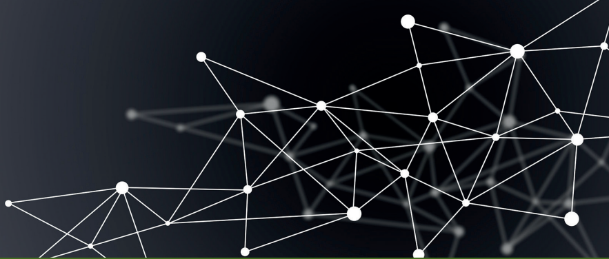
Tableau d'organisation du M2